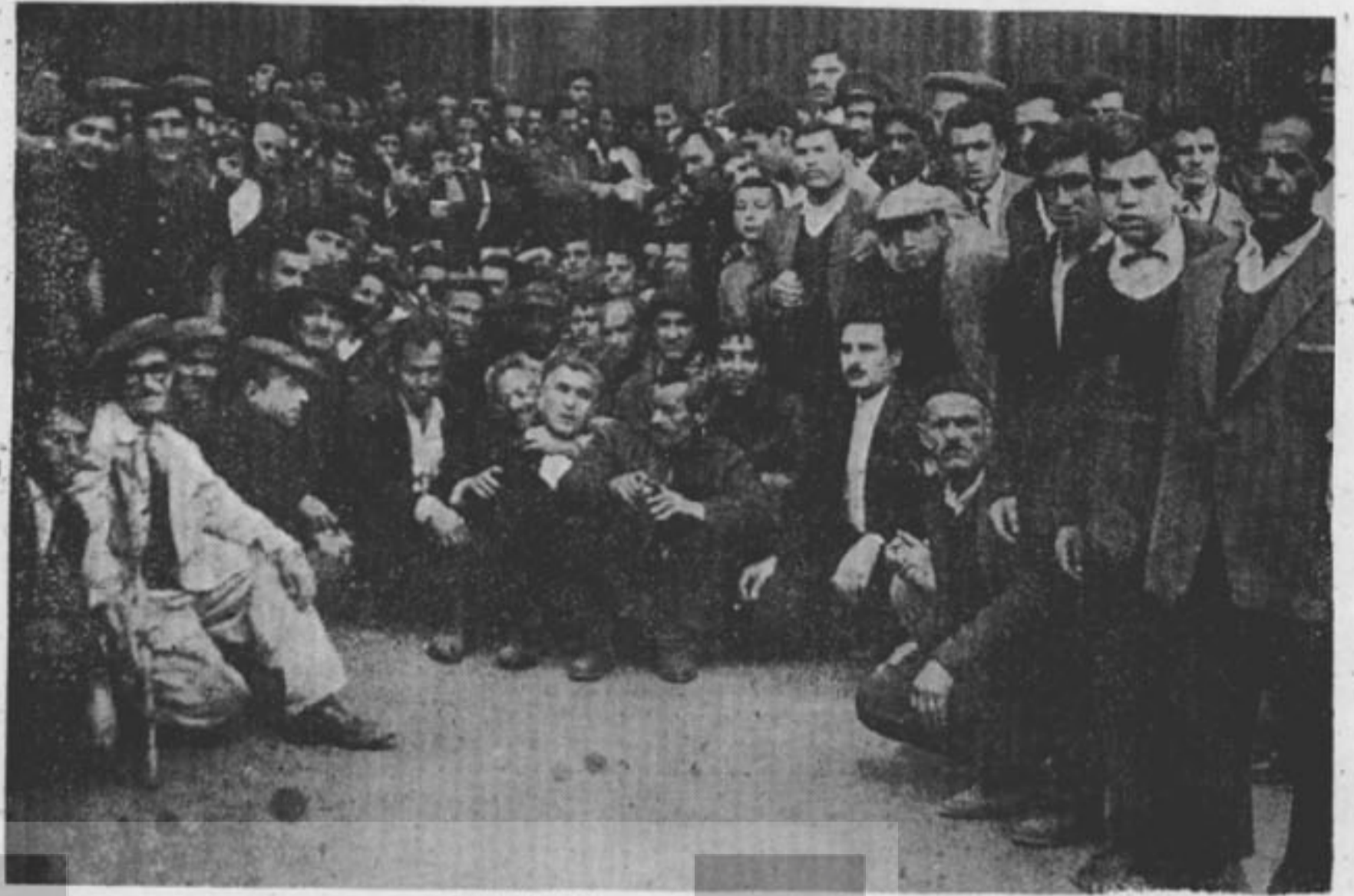
Adalet fabrikasının kapısına bırakılan işçilerden bir grup...

Grev hareketi üzerine işçilere yar- dım, gelişti, hekimler, eczacılar te-