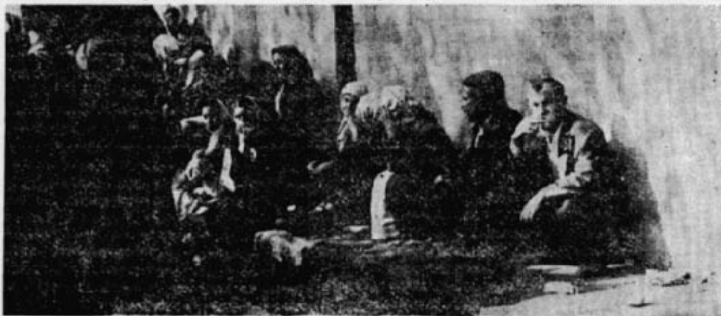
Adalet'in işçileri duvar diplerinde kapıların açılmasını bekliyor — Sadece çalışmayı bilirdiler şimdi hak aramasını da biliyorlar —

Adalet Fabrikasının önünde büyük bir işçi kütlesi.. İhtiyarlar, gençler, kadınlar, kızlar.. Kavel grevinden kalma bir çadır içinde gönüllü doktorlar, hastaları muayene ediyorlar.. Az ötede bir topluluk var, davul, klarnet çalıyor, ortada gençler hora tepiyorlar. Bir yöneticinin omzunda küçük bir hoparlör, geziniyor, gerekli zaman konuşuyor.