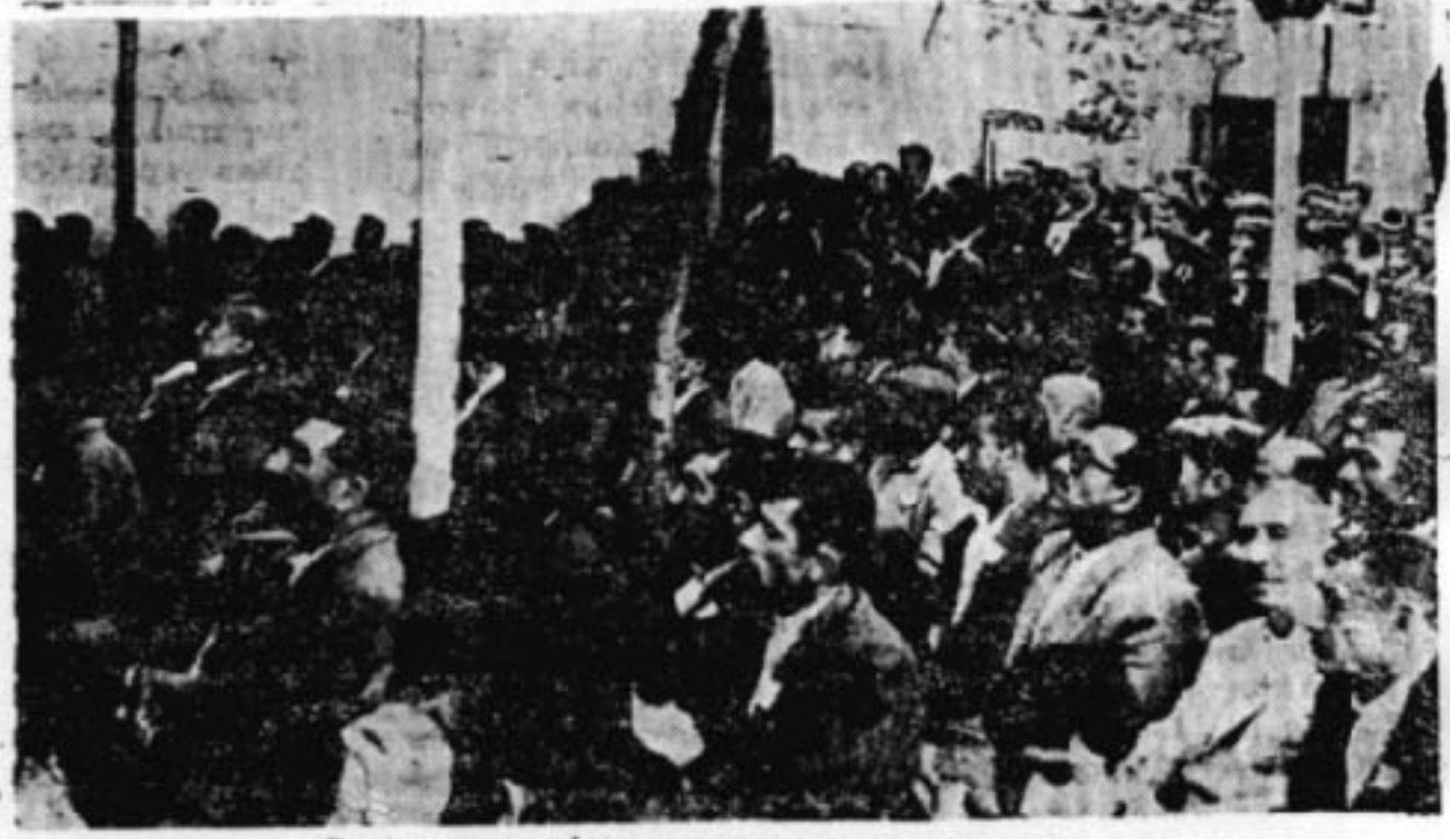
Gaziantep'te T.I.P. Genel Yönetimi..