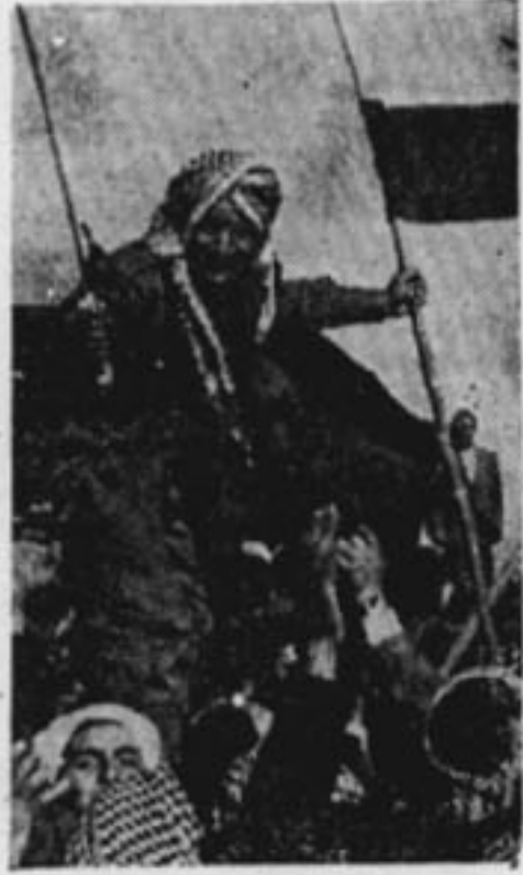
— Aktif direnişme başladı —

yılında açıkladığı bir rakka- ma göre ırk ayrılığı Amerikaya yıl- da 13 milyar dolara mal olu- yor. Ekonomik, yarışmala ça- ğında kaybedilen bu noktâ A- merikan ekopomisini sarstı.cı.