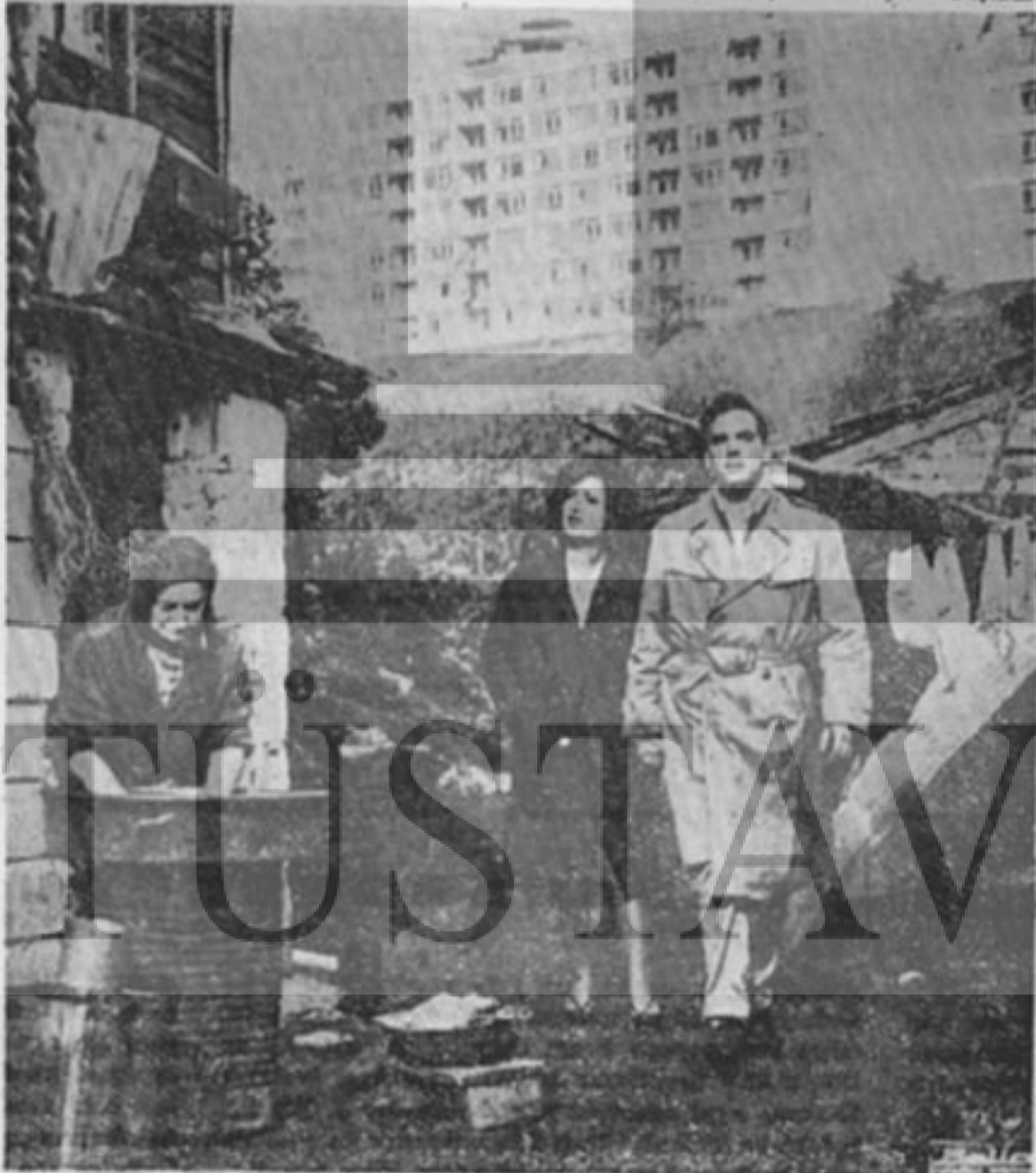
«Acı Haya'ta toplumdaki tezdâ veren bir sahne

Refik Cevat Ulunay bile Milliyet'te sunuları yazmıştı: