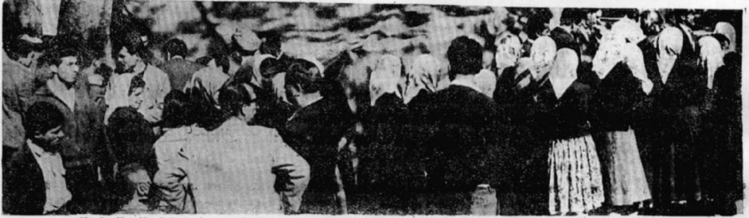
36 gün Kavel'in önünde duran çadır, Adalet fabrikası önüne taşınmış hasta işçiler için muayenehane olarak kullanılmıştı.