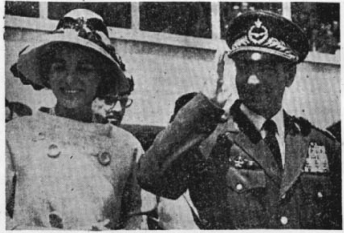
Halkın derdinden habersiz bir çift Şah ve Diba

Demokrat senatör, başkanı bu'un bir toplantıda, Bahtiyari aşiretinin Reisi Haybar Han'ın ileri sürdüğü bu iddiaları ve dellil olarak ibraz edilen vesikaları incelediğini anlatmış ve demiştir ki: «Bu iddialar doğru çıktığı alt komitenin dün yaptığı gizli gi takdirde İrana yapılan Amerikan