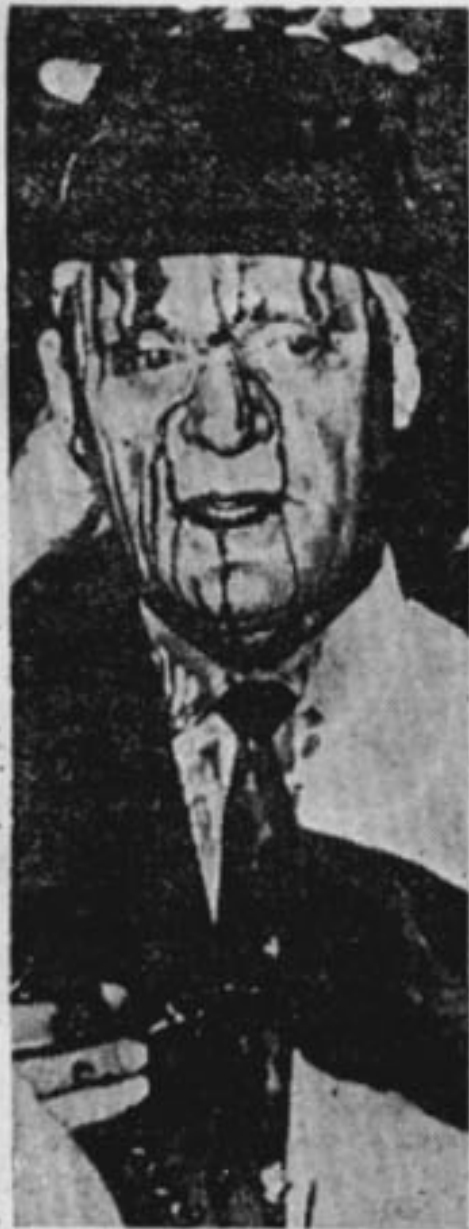
— Sokaklar Nasır'ın —

Herhalde bunların ve hukuk sahasında daha pek çok çözü- lüğün ortadan kaldırılması zma- nı gelmiştir. Kapitalist bir top- lumda bütün düşüncenin «kâr» a ayarlandığı düşünülürse zi- yanlı bu işe bir an önce son verilecektir.