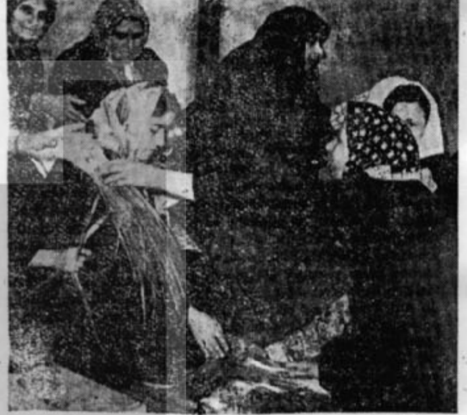
Grevcilere, soğan ayı kıyan kadın işçiler — Dayanışma işbirliği ile mümkün —

Ekmekler gelliyor Az sonra kalabalığın arasına, yavaş yavaş mavi bir taksî sokuldu. İşçiler hemen etrafında halka oldular. Gelen, Çıkmış Kumaş Fabrikasından bir işçi idi. Terlemişti, çok heyecanlı