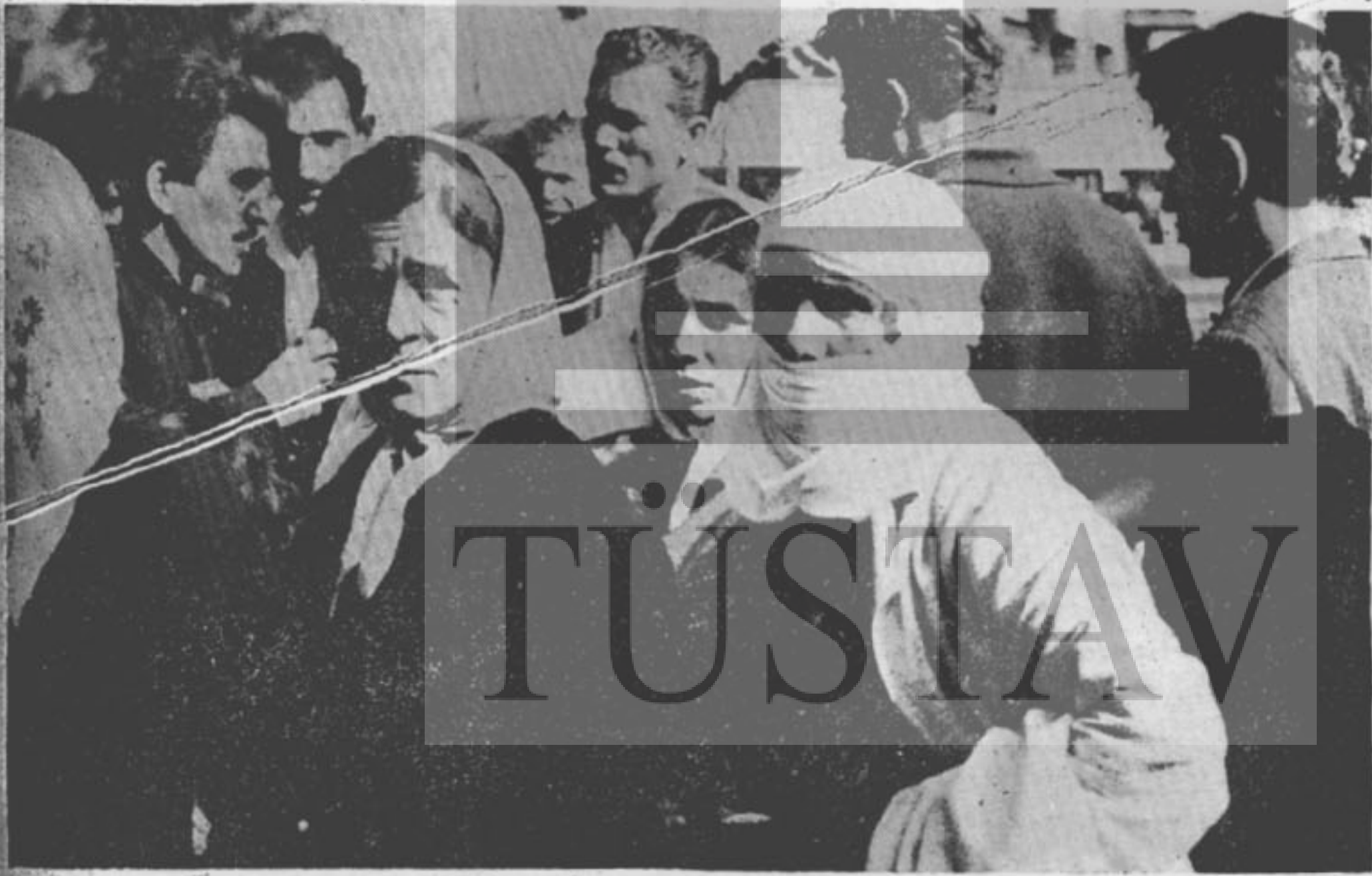
KAPATILAN KAPILAR ÖNÜNDE İŞÇİLER