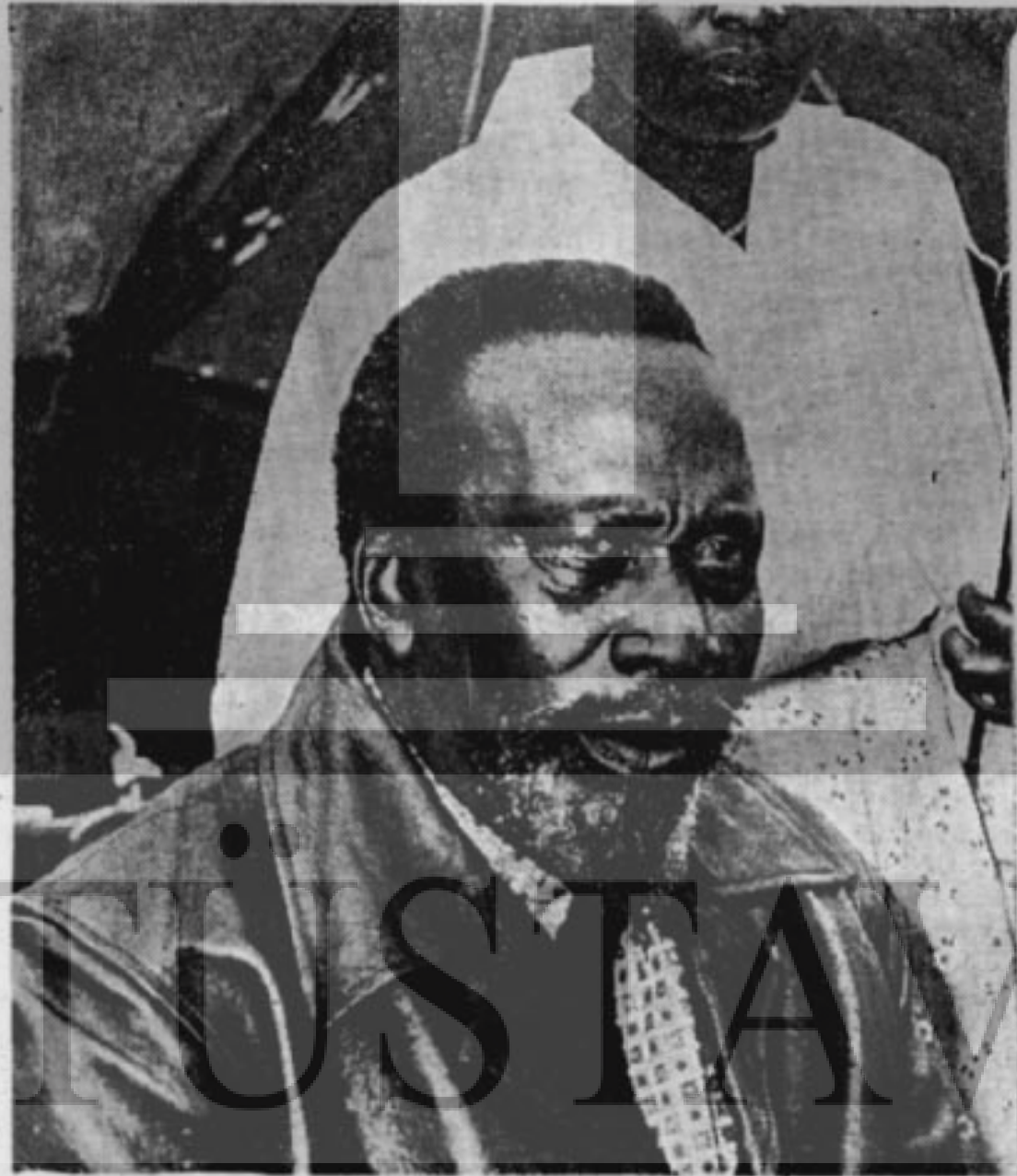
Jomo Kenyatta Afrikanın ilerici liderlerinden

yeti artık biliniyor. Cezayir'de Standard Oil ve Gulf Oil Fransız şirketleriyle birlikte bir milyar ton tahmin edilen sahra petrolerini çıkarıyorlar. Amerikan şirketleri Nijerya, Angola, Habeşistan ve Somali'de de faaliyette. Amerika Katanga (Kongo) ve Güney Afrika'daki uranyuma da sıkı sıkıya bağlı.