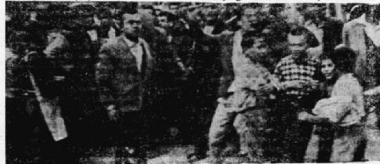
İşte, kandırılmış tahrirkilerden zavallı bir grup..

«Mesele oy avcılığı değil. Halk bugün çoğullukla gerici ve tutucu partilerin arasında görünüyorsa bunun nedeni yakın zamanlara kadar hiç bir siyasi partinin gerçekten halkı temsil edememesidir. T.I.P. kuruluncaya kadar halka dayanan ve onun gerçek isteklerini temsil eden bir parti yoktur. T.I.P.'in tarihindeki büyük önemi budur. T.I.P. Türk tarihinde ilk defa olarak aşağıdan yukarıya doğru halka en yakın olan işçilerin kurduğu tek partidir. Türk işçisi kendi eliyle kurduğu bu parti yoluyla aydınlarla elele tutuşmak istemiştir.» demiştir.